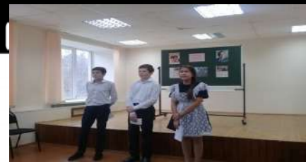
С 2 по 10 октября прошла предметная декада башкирского языка и литературы. Были проведены открытые уроки, внеклассные мероприятия, конкурсы сочинений, рисунков.