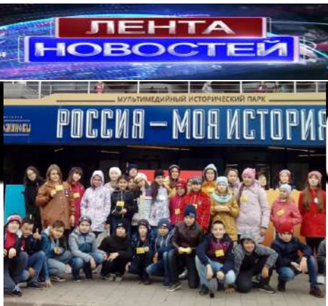
3 октября учащиеся 5-х, 6а классов участвовали в акции "Дороги Победы". Они посетили Парк Победы и исторический музей "Россия – моя история".

Напоминаем условия конкурса. В каждом номере газеты внимательно читайте все статьи и ищите слово, которого в какой-либо статье по смыслу просто не должно быть! Его вы и должны найти. Оно будет выделено, а напечатано обычным шрифтом. Даем подсказку: это будут фамилии известных в Башкортостане людей. И в каждом номере – разные. Победитель ждет слащавый приз! Дата выпуска: 24.10.2019 г. Тираж: 50